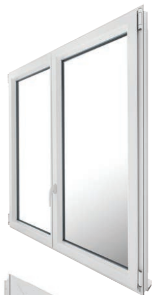
Vue intérieure finition galbée

Poignée Sécustik® : Toute manipulation de crémonne par l'extérieur, hors vitrage cassé, est rendue impossible grâce au mécanisme de verrouillage auto-bloquant. Les clics sonores émis lors de la manipulation garantissent la mise en place du système de sécurité.