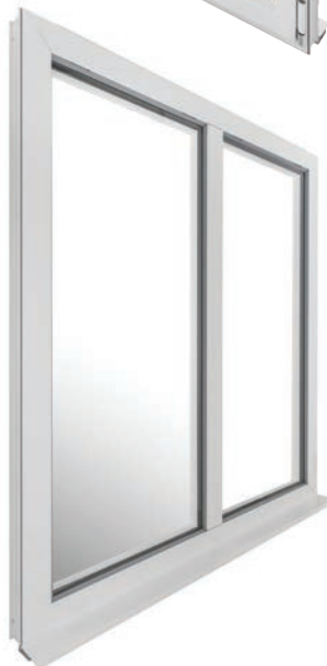
Vue extérieure ouvrant caché